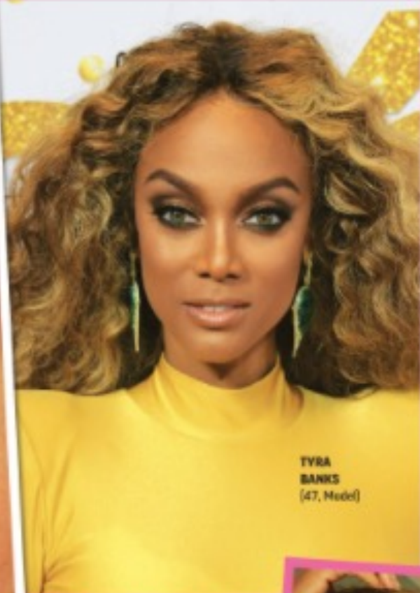
TYRA BANKS (47, Model)

Der Preis richtet sich nach der Menge der eingesetzten Haarfollikel und liegt zwischen ca. 1000 und 3500 Euro. Infos unter: bodenseeklinik.de